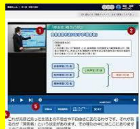
オンデマンド科目はインターネット上で実施